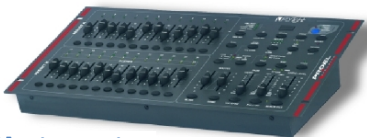
[2] Mixer Luci

Per l'utilizzo dell'impianto luci è necessario verificare che l'interruttore del Mixer Luci (vedi foto [2]) sia in posizione "ON". Per il funzionamento dell'impianto è necessario disattivare il pulsante "BlackOut" (Posto nell'angolo in basso a destra del mixer), mettere a 0s il cursore "Fade" e il cursore "Speed". Inoltre è necessario posizionare tutti i due cursori "Master" su 10 e selezionare la modalità "Single Preset" (Vedi foto [3]) tramite l'apposito pulsante "Mode Select".